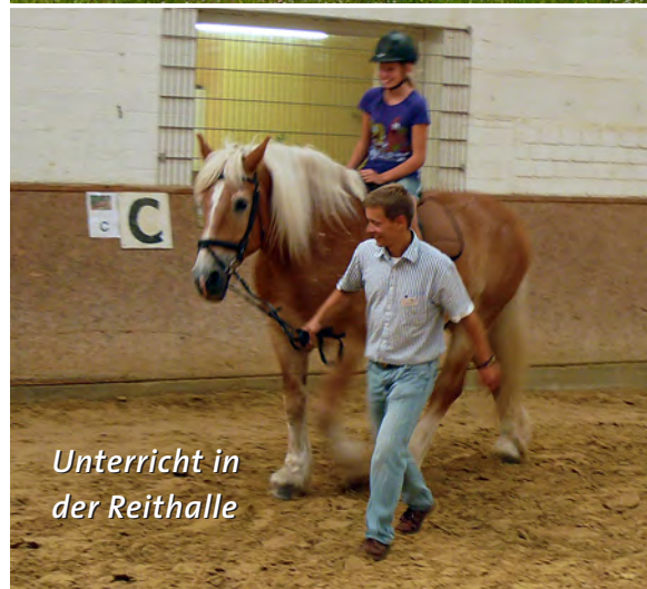
Unterricht in der Reithalle