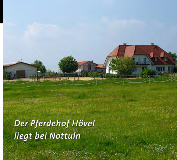
Der Pferdehof Hövel liegt bei Nottuln

Grafikbüro Michael Cords | Wuppertal | www.micrografik.de